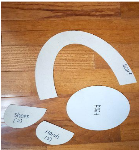
Imagen Santa María