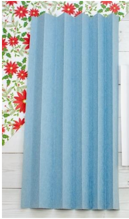
Imagen Santa María