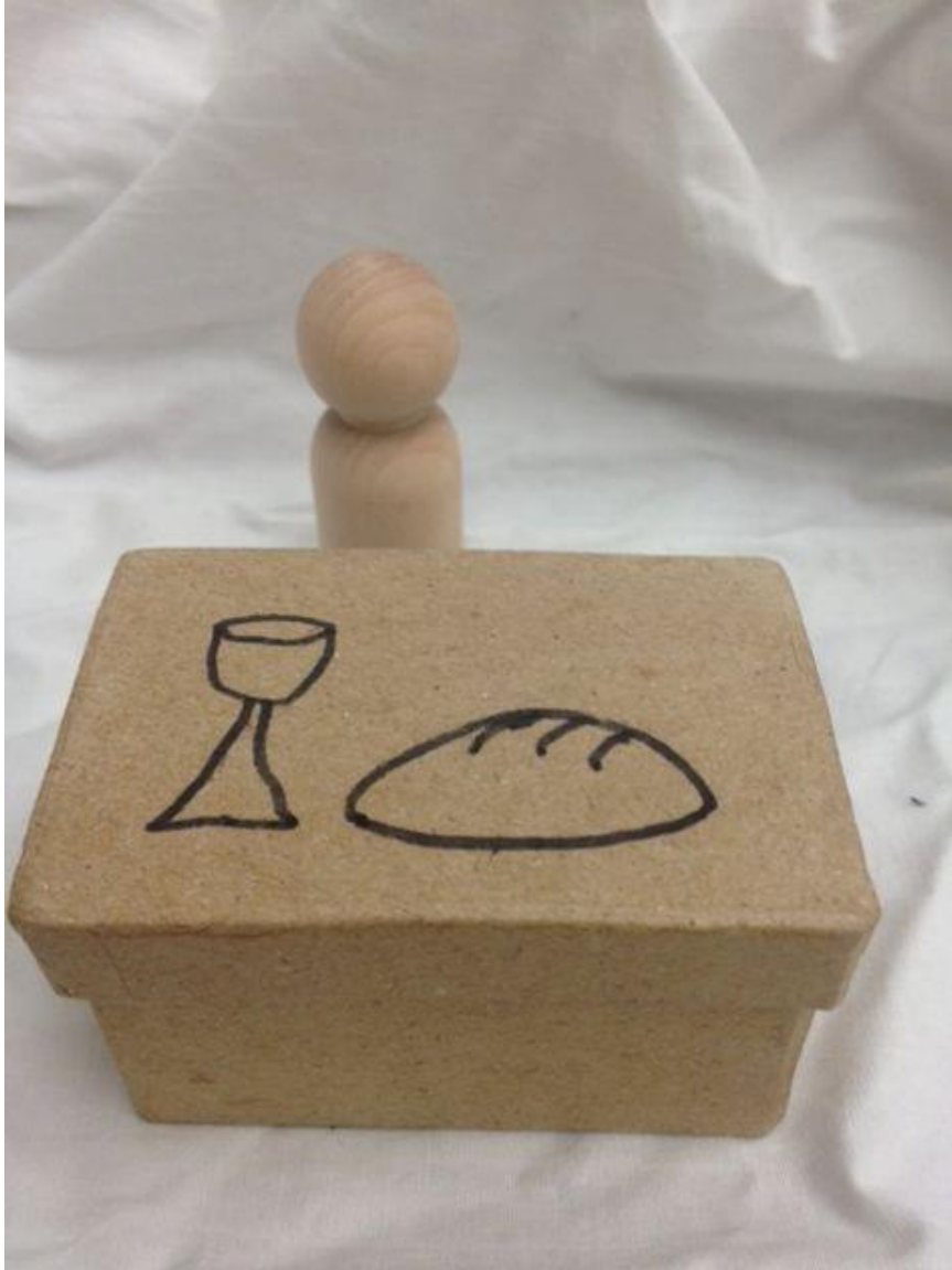
Última cena de cartón