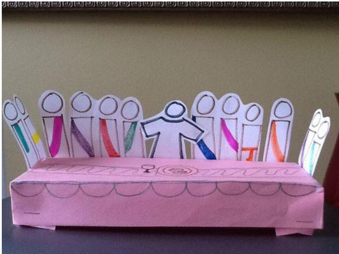
Ultima cena con papel